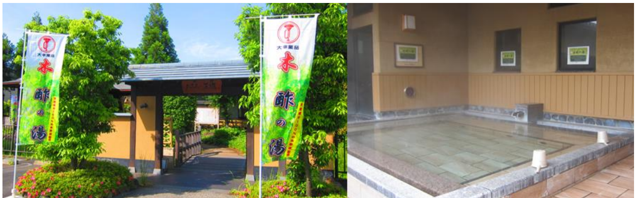
『木酢の湯』イメージ（「おふろの王様」埼玉県志木店）

大幸薬品株式会社（本社：大阪市西区、代表取締役社長：柴田高、以下、大幸薬品）は、「正露丸」を製造する際にできる副産物を使用したお風呂『木酢の湯』を全国展開することを発表いたします。首都圏を中心に運営する おふろの王様 (※1) （東京建物リゾート株式会社）への導入を皮切りに、2018年5月18日（金）より、スーパー銭湯などの大型入浴施設への本格導入を開始いたします (※2) 。